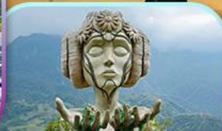
Moana Sapa Cafe