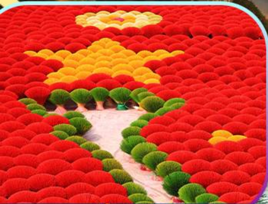
หมู่บ้านรูป