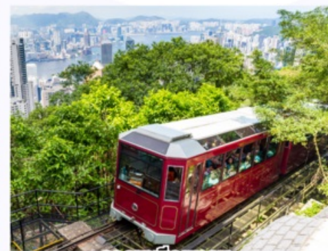
รถรางพิกแตรม