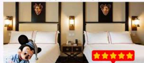
พัก Disney Explorers Lodge 5 ดาว 1 คืน