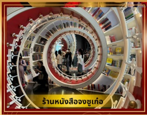
ร้านหนังสือจูกูเก้อ