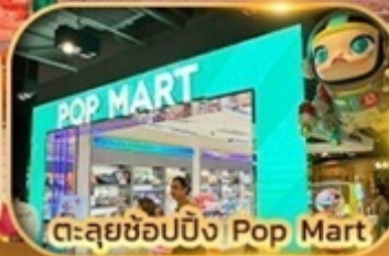
ตะลุยช้อปปิ้ง Pop Mart