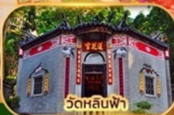
วัดหลินฟา