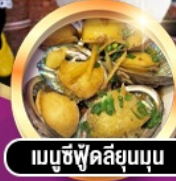
เมนูซีฟู้ดลิ้นมด