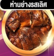
हांอย่างรสเลิศ