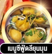
เมนูซีฟู้ดลิ้นจี่