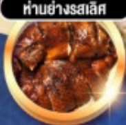
ทำอย่างรสเลิศ