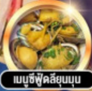
เมนูซีฟู้ดลือลุ่มลุ่ม