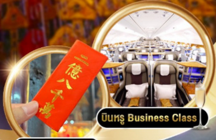
บินหรู Business Class