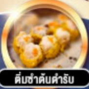
ต้มซ่าดับคำรับ