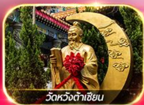
วัดหวงต้าเซียน