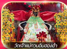
วัดเจ้าแม่กวนอิมฮองฮ่า