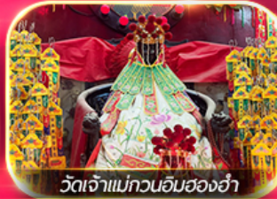
วัดเจ้าแม่กวนอิมสองอ่า