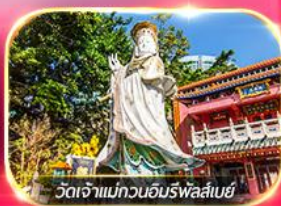
วัดเจ้าแม่กวนอิมรพาส์เบย์