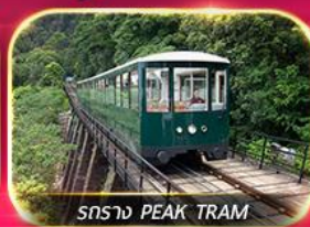
รถราง PEAK TRAM

เที่ยวสวนสนุกแบบจัดเต็ม ทั้งอิมบุงยู และ ซอปบิง จิมซาจู้ย มงก๊ก