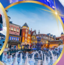
โรงงานช็อคโกแลต ชิโรอิ โคอิโมโตะ