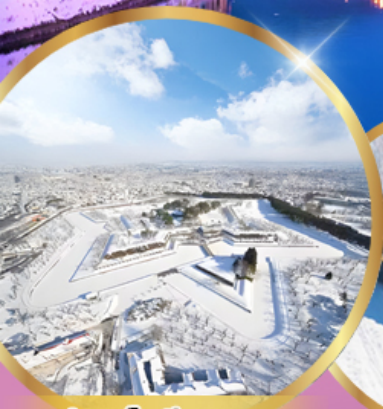
ป้อมโทเรียวคาคุ