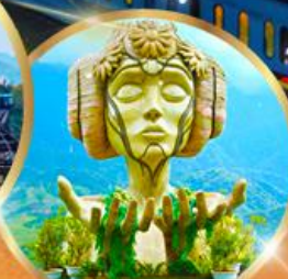
โมนาน่า คาเฟ่