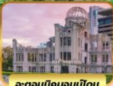
อะตอมบิคมอบบิโดม