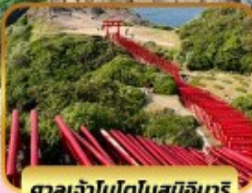
ศาลเจ้าโมโตโนสุมิอินาริ