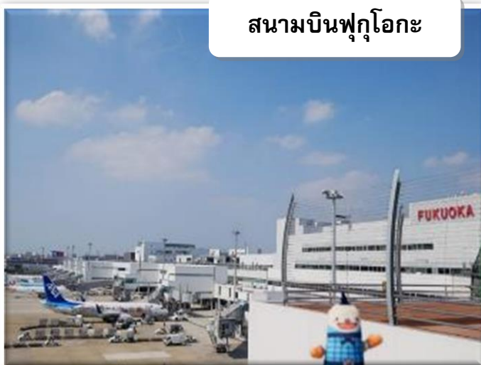
สนามบินฟุกุโอกะ

บริการอาหารร้อนบนเครื่องพร้อมกับเมนูผลไม้สดเพื่อเติมเต็มความพิเศษไปพร้อมกับความสดชื่น