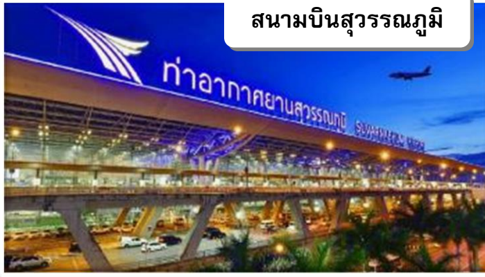
สนามบินสุวรรณภูมิ

เวลา 21.00 น. พร้อมกันที่ ท่าอากาศยานสุวรรณภูมิ อาคารผู้โดยสารขาออกระหว่างประเทศ เคาน์เตอร์ สายการบินไทย เจ้าหน้าที่คอยให้การต้อนรับ ดูแลด้านเอกสาร เช็คอิน และสัมภาระในการเดินทาง