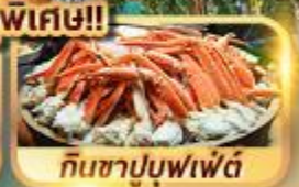
กินซาปูบุฟเฟ่ต์