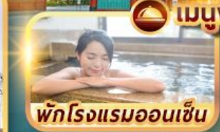
พักโรงแรมออนเซ็น