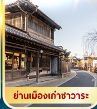
ย่านเมืองเก่าซาวาระ