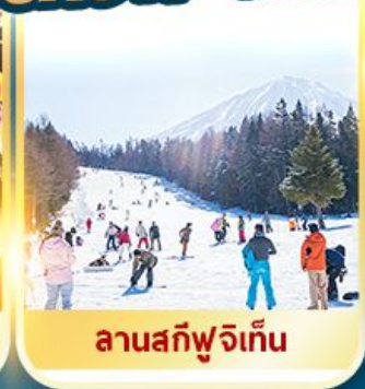
ลานสกีฟูจิเท็น