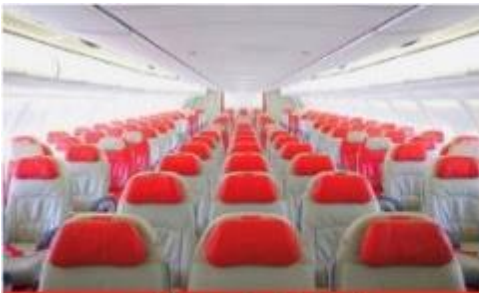
เครื่องบินใหญ่ 377 ที่นั่ง

ตัวเครื่องบินเป็นตู้กรู๊ปสำหรับคณะทัวร์ ระบบของสายการบินจะทำการแรนดอมที่นั่ง ซึ่งไม่สามารถล็อกหรือเลือกกระบูกี่ที่นั่งได้ หากลูกค้าต้องการเลือกกระบูกี่ที่นั่ง ทางสายการบินมีบริการอัพเกรดที่นั่ง (ค่าบริการเป็นไปตามที่สายการบินกำหนด)