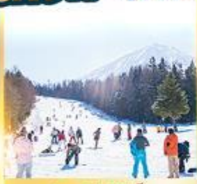
ลานสกีฟูจิเท็น