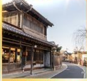
ย่านเมืองเก่าซาวาระ