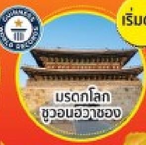
มรดกโลก อุทยานฮวาซอง