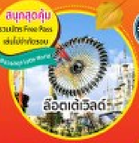
สนุกสุดคุ้ม รวมบัตร Free Pick เล่นฟรีทั่วประเทศ