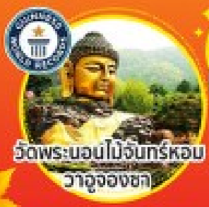
วัดพระบอนไม้จันทร์หอม วาจูจองซา