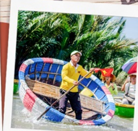
ล่องเรือกระดิง