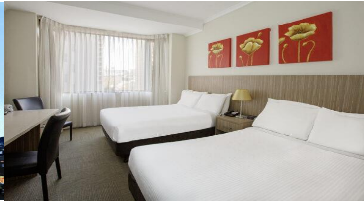
(โรงแรมย่านกลางเมือง ใกล้แหล่งช้อปปิ้ง เดินทางสะดวก) *รูปภาพเพื่อการโฆษณา*