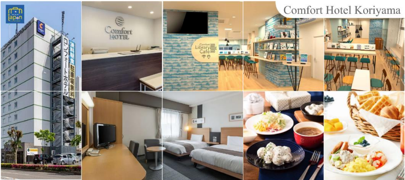
Comfort Hotel Koriyama

เย็นพักที่ อิสระรับประทานอาหารเย็นตามอัธยาศัย COMFORT HOTEL KORIYAMA หรือระดับเดียวกัน