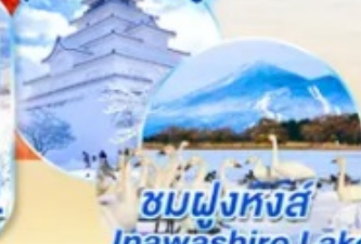
ชมฝูงหงส์ Inawashiro Lake