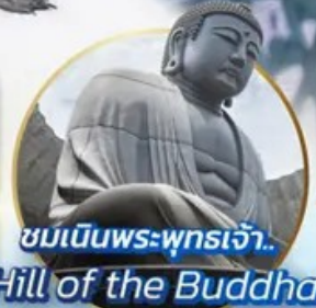
ชมเนินพระพุทธรเจ้า Hill of the Buddha

📍 ไฮไลท์!! สนุกสนานกับกิจกรรมทะเลหิมะ ณ ลานสโนว์ เวิลด์ ฮักไซฟาโนรามา เยี่ยมชมเนินพระพุทธรเจ้า ชมความน่ารักเหล่าสัตว์ ณ สวนสัตว์อาซาฮิยาม่า ชมคลองโอดาธา เข้าชมพิพิธภัณฑ์ถักสวองดนตรี ล้อมรสรามง ณ หมู่บ้านราเมนอาซาฮิคาว่า ช้อปบิงจูกา กาบุคิโคจิ อีเมอร์ออย!! บุปเฟ่ต์ซาบู และซาบูยิกนรี่