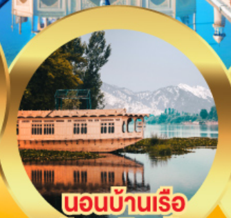
นอนบ้านเรือ วิวเขาหิมาลัย