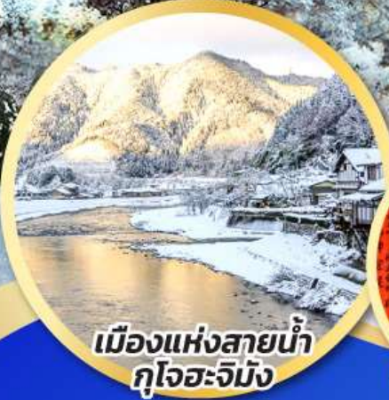
เมืองแห่งสายน้ำ กุโจะจิมัง