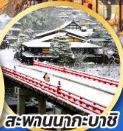
สะพานนากะบาชิ

ชมเมืองแห่งสายน้ำ บรรยากาศย้อนยุค "กุโจะจิมัง"