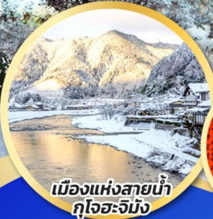
เมืองแห่งสายน้ำ กุโจะจิมัง