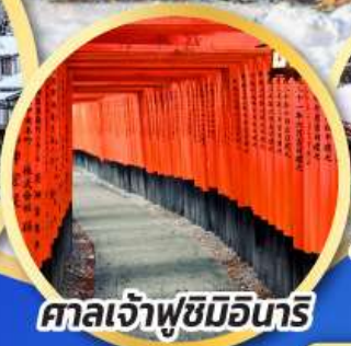
ศาลเจ้าฟูชิมิอินาริ