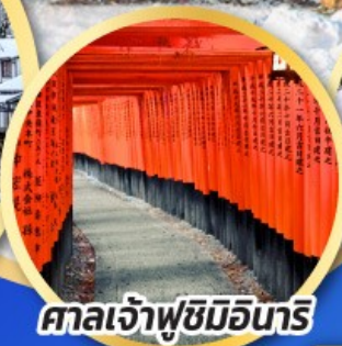
ศาลเจ้าฟูชิมิอินาริ