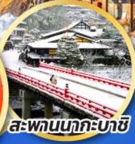
สะพานนากะบาชิ

ชมเมืองแห่งสายน้ำ บรรยากาศย้อนยุค "กุโจะจิมัง"