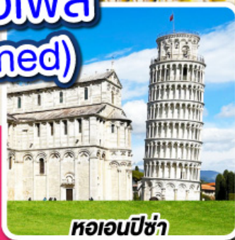
หอเอนปิซ่า