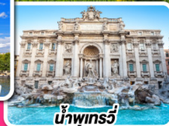
น้ำพุทรี