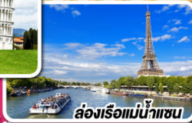
ล่องเรือแม่น้ำแซน