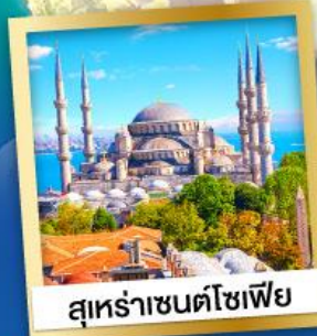
สุหระชาชนตโซเฟีย