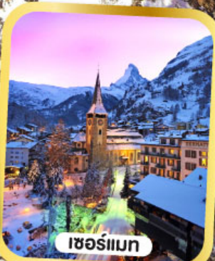
เซอร์แมน