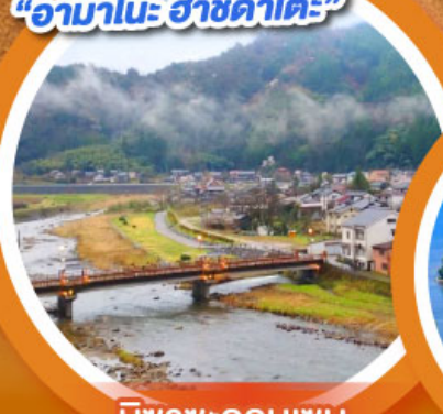
มิซาซะออนเซน