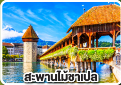
สะพานไม้ชาเปล