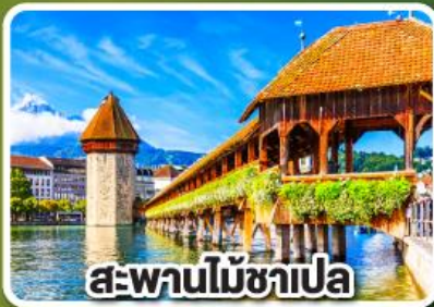
สะพานไม้ชาเปล