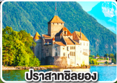
ปราสาทชิลยอง