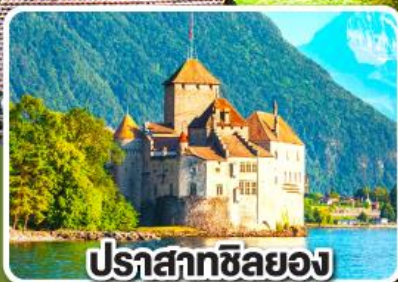
ปราสาทซิลยง