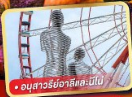
• อูสาวรีย์อาลีและนีโ