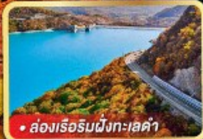
• ล่องเรือริมฝั่งทะเลดำ