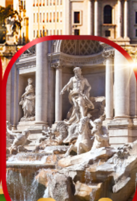
น้ำพุกรวี