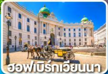
ฮอฟบิรทเวียนนา