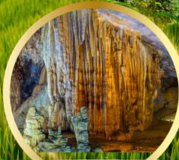
ถ้ำสวรรค์