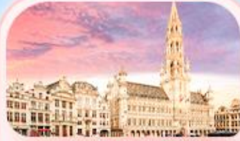
บรัสเซลส์