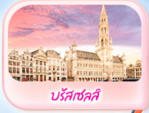
บรัสเซลส์