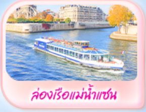
คลองเรือแม่น้ำแซน