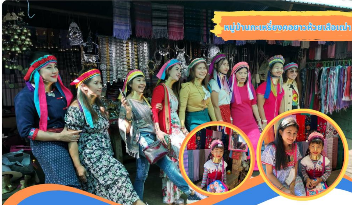
หมู่บ้านกะเหรี่ยงคอยาวห้วยเสือเฒ่า

นำท่านสู่ หมู่บ้านกะเหรี่ยงคอยาว “ห้วยเสือเฒ่า” เป็นกะเหรี่ยงคอยาวที่อพยพมาจากบ้านน้ำ เพียงดิน มีวิถีชีวิตความเป็นอยู่ที่คล้ายกัน ตั้งบ้านเรือนอยู่ในหุบเขา และมีลำห้วยไหลผ่าน