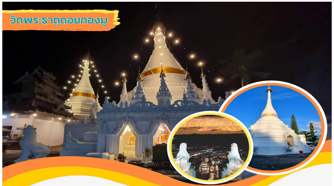
วัดพระธาตุคอกงมู

นำท่านเดินทางไป พระธาตุคอกงมู อยู่ในเขต อ.เมือง จ.แม่ฮ่องสอน ให้ท่านได้นมัสการพระ ธาตุคอกงมู และชมทัศนียภาพอันงดงามของเมืองสามหมอกจากมุมสูงกันตามอัธยาศัย พร้อม สักการะพระธาตุของพระอัครสาวกของพระพุทธเจ้า