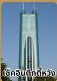
เซ็กอินตึกตีห้วง