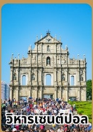
อิหารเซนต์ปอล