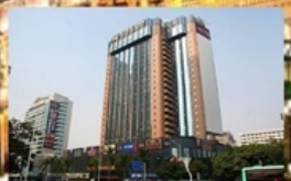
South Union Hotel