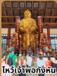
ไหว้เจ้าพ่อกั้งหัน