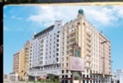
Grand Inn Hotel

กินอิ่ม นอนอุ่น พักหรู อยู่ดี การ์ันตี 4 ดาว