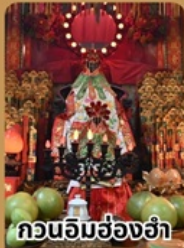
กวนอิมช่องฮ่า