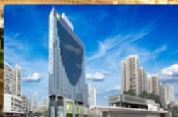
i Club Mongkok