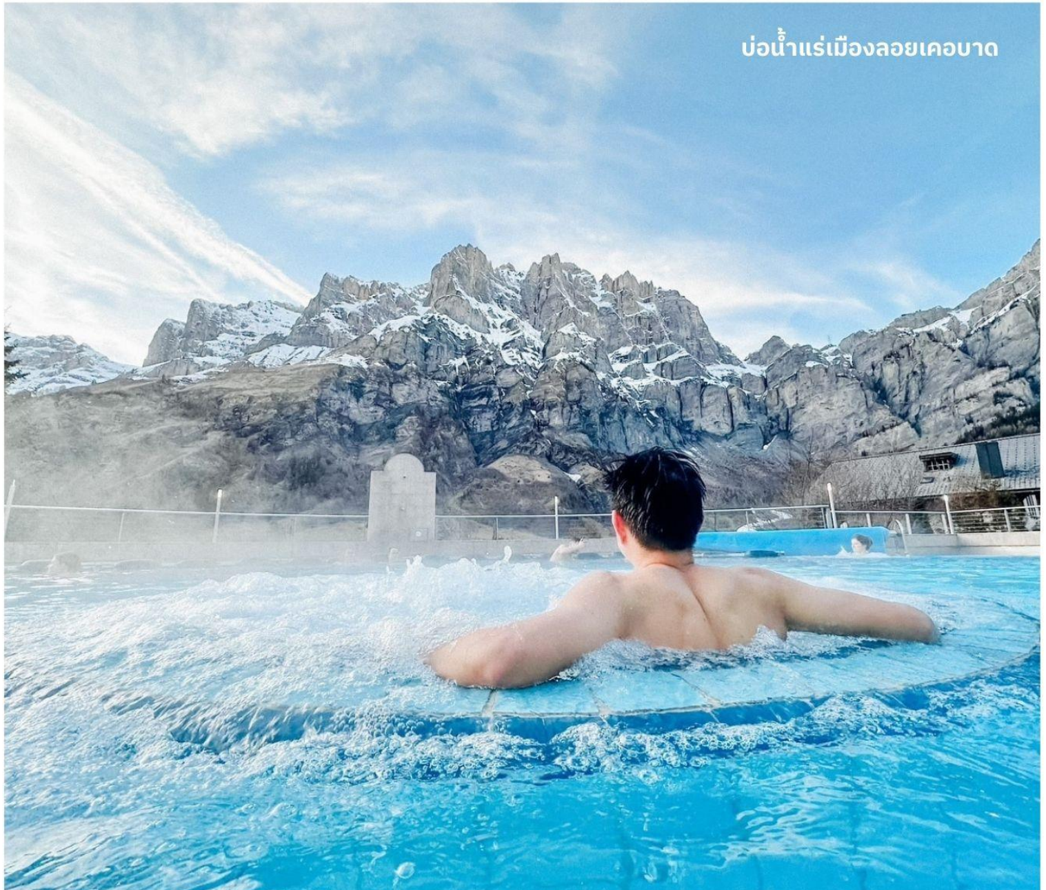
บ่อน้ำแร่เมืองลอยเคอบาด

นำท่านเข้าสู่ที่พัก Le Bristol Leukerbad หรือเทียบเท่า