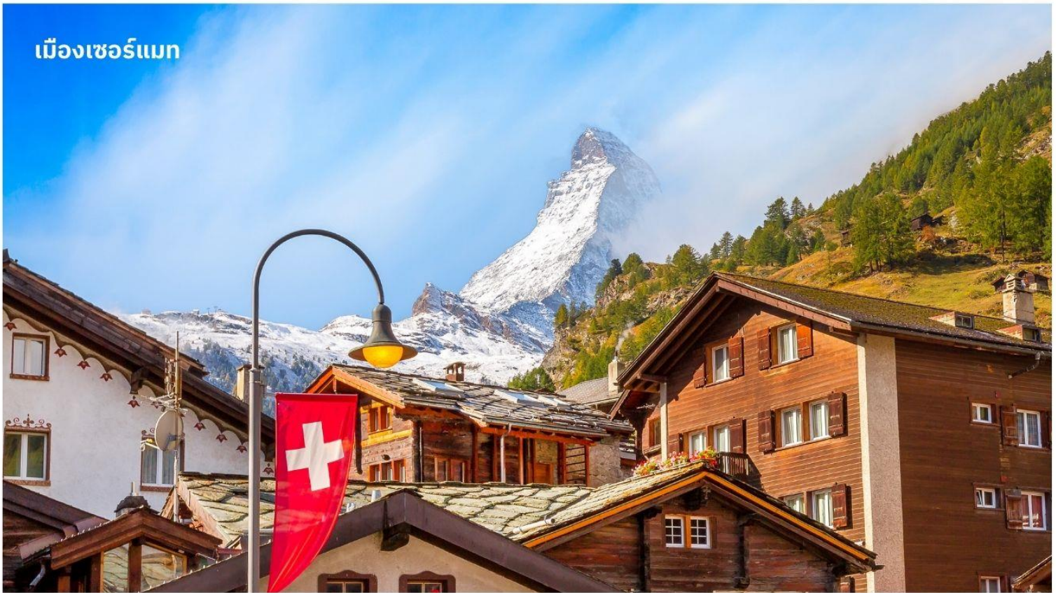
เมืองเซอร์แมท

จากนั้นนำท่านเดินทางสู่ เมืองแทสช์ (Tasch) ใช้เวลาเดินทางประมาณ 1.30 ชั่วโมง ตั้งอยู่ในประเทศสวิตเซอร์แลนด์ เป็นประเทศขนาดเล็กที่ไม่มีทางออกสู่ทะเล และตั้งอยู่ในทวีปยุโรปตะวันตก ซึ่งมีเทือกเขาแอลป์ซึ่งเป็นเทือกเขาที่ใหญ่ที่สุดของทวีปยุโรป เลาะเลียบตามหุบเขา ชมทิวทัศน์สวยอันงดงามตลอดเส้นทาง