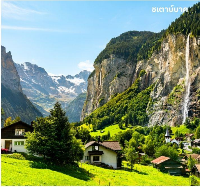
ชเตาบับาค

บนยอดเขา จากนั้นนำท่านลงจากยอดเขา จุงเฟรา และเดินทางสู่ เมืองลาเทอบรุนเนน (LAUTERBRUNNEN) นำท่านเดินเล่นแะ ถ่ายภาพกับหมู่บ้านเล็กๆในหุบเขาที่แยกเป็นสอง แพรง เจียบสงบที่ไม่วุ่นวาย โดยมีฉากหลังของ หมู่บ้านคือน้ำตกที่มีชื่อเสียงที่สุดชื่อว่า ชเตาบับาค (Staubbach) น้ำตกที่มีความสูง 300 เมตร และเป็นหนึ่งในน้ำตกที่ตกลงมา แบบม้วนเดียวจบที่สูงที่สุดในยุโรป