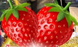
มีผลตอบเอบอจึสุด ๆ จากรั้