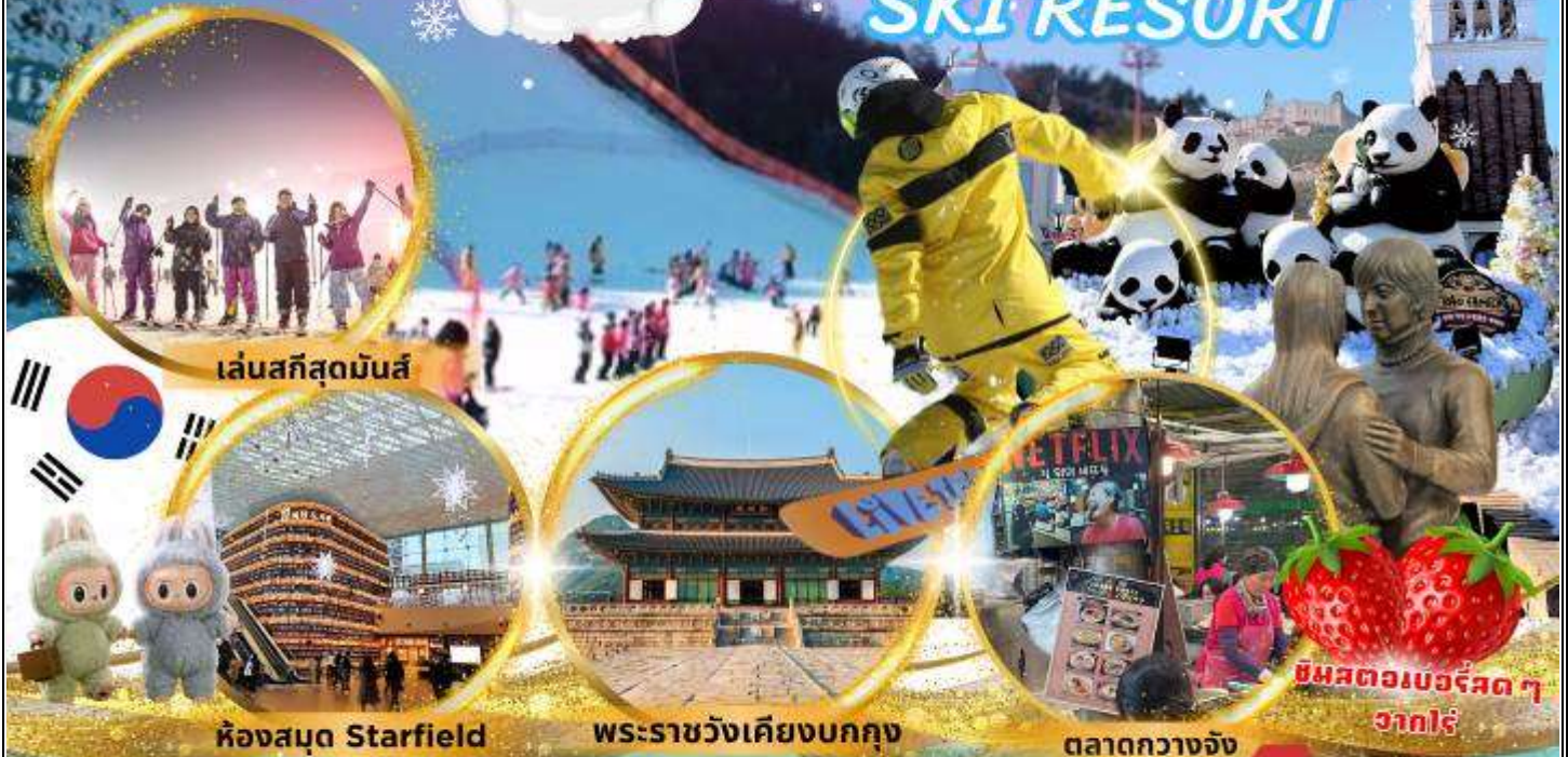
เล่นสกีสุดมันส์