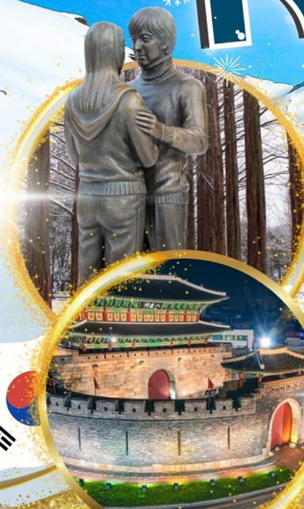
ป้อมฮวาซอง