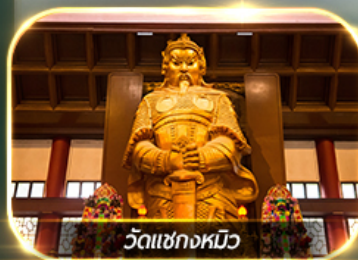
วัดแชกงหมิว