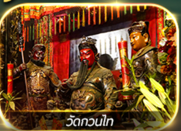
วัดกวนไท

ไหว้ 8 เซียนวัดดัง ปิงไม่หยุด ครบถ้วน!! การเงิน การงาน ความรัก และสุขภาพ นั่งรถราง PEAK TRAM, ชมวิวยอดเขาวัดตอเรีย, เจ้าแม่กวนอิมหาดริฟลิสเบย์, วัดหลินฟ้า, วัดเจ้าแม่ทับทิม วัดหวังต้าเซียน, วัดกวนไท, วัดสองอ้า, วัดแชกงหมิว, กระเช้านองปิง 360, พระใหญ่เทียนถาน