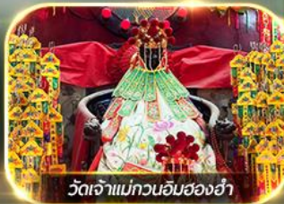
วัดเจ้าแม่กวนอิมสองห้า