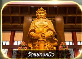
วัดแชกงหมิว