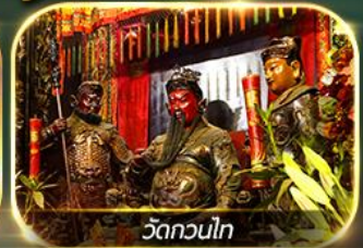
วัดกวนไท

ไหว้ 8 เซียนวัดดัง ปิงไม่หยุด ครบถ้วน!! การเงิน การงาน ความรัก และสุขภาพ