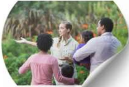
ซื้อทัวร์เสริม