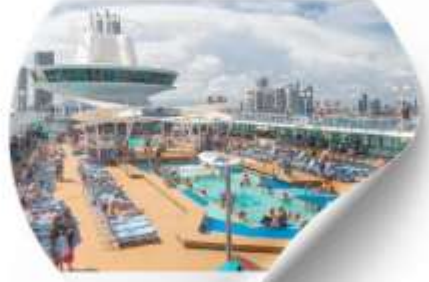
พักผ่อนบนเรือ