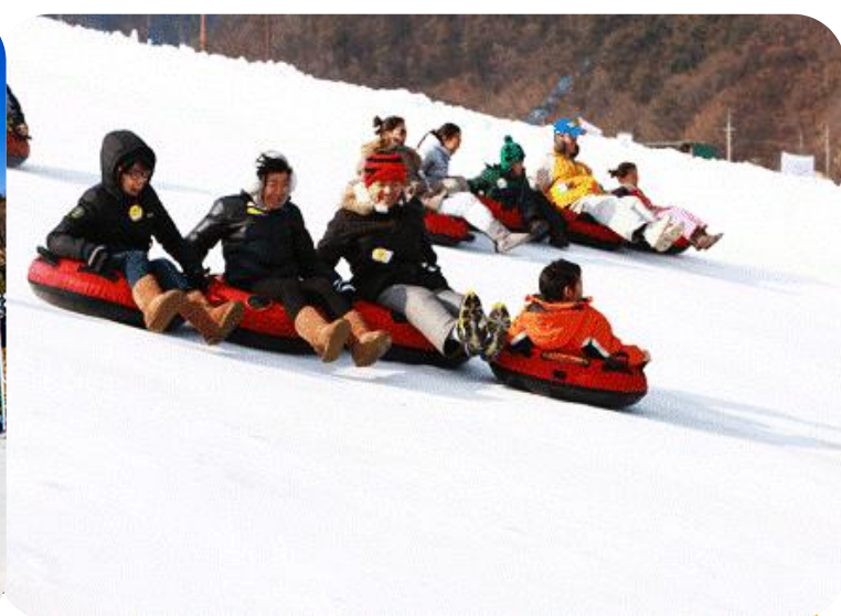
สาคู และชหอยูกบสภาพการณปัจจุบัน