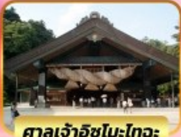
ศาลเจ้าอิซุโมะโทะวะ