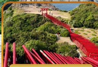
ศาลเจ้าโมโตโนสุมิอินาริ