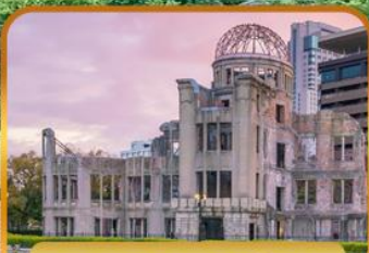
อะตอมมิกบอมบ์โดม