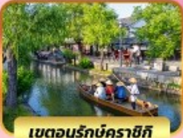
เขตอูร์กบิคุราชิกิ