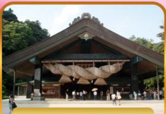
ศาลเจ้าอิซุโมะโทะวะ