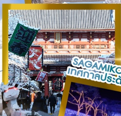
SAGAMIKO ILLUMILLION เทศกาลประดับไฟปีมีครั้ง!