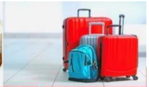
น้ำหนักกระเป๋า สูงสุด 20 กก.