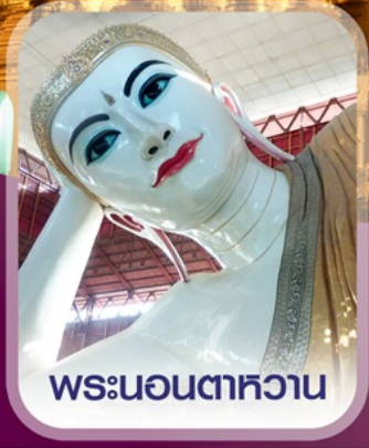
พระนอนตาทหวน