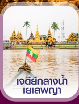
เจดีย์กลางน้ำ เยเลพญา

เชิควิน ย่างกุ้ง สีเรียม พระมหาเจดีย์ชเวดากอง ไหว้พระ 5 วัด เสริมบุญ ต้อนรับศักราชใหม่