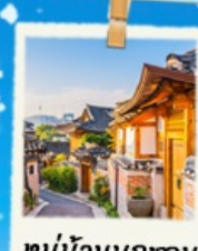
หมู่บ้านนุกซอน