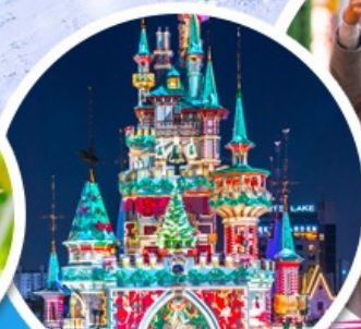
สวนสนุกค็อดเต้