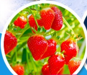
ไร่สตรอว์เบอร์รี่