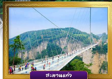
สะพานแก้ว