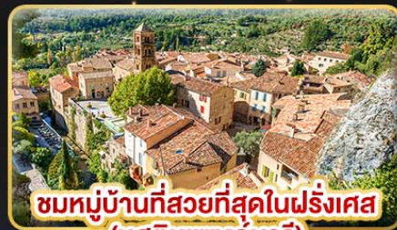
ชมหมู่บ้านที่สวยงามที่สุดในฝรั่งเศส (มุสตีเยแซงท์มารี)