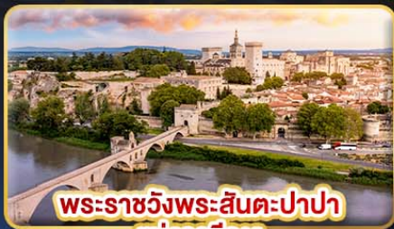
พระราชวังพระสันตะปาปา แห่งอเวัญ