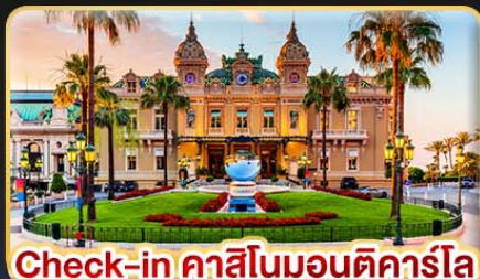
Check-in คาสิโนมอนติคาร์โล