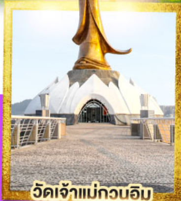
วัดเจ้าแม่กวนอิม