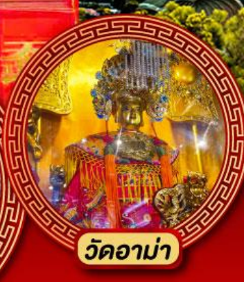
วัดอาม่า