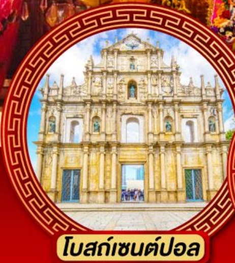
โบสถ์เซนต์ปอล