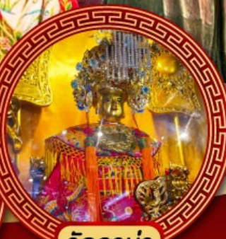
วัดอาม่า