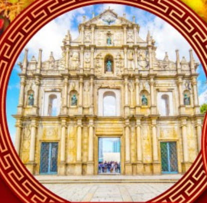
โบสถ์เซนต์ปอล