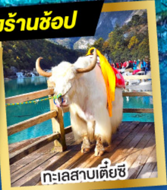
ทะเลสาบเตี๋ยซี