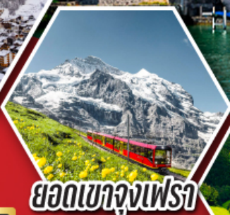
ยอดเขาจุงเฟรา