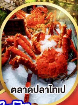
ตลาดปลาไทเป