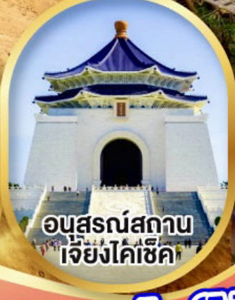
อนุสรณ์สถาน เจียงไคเช็ค